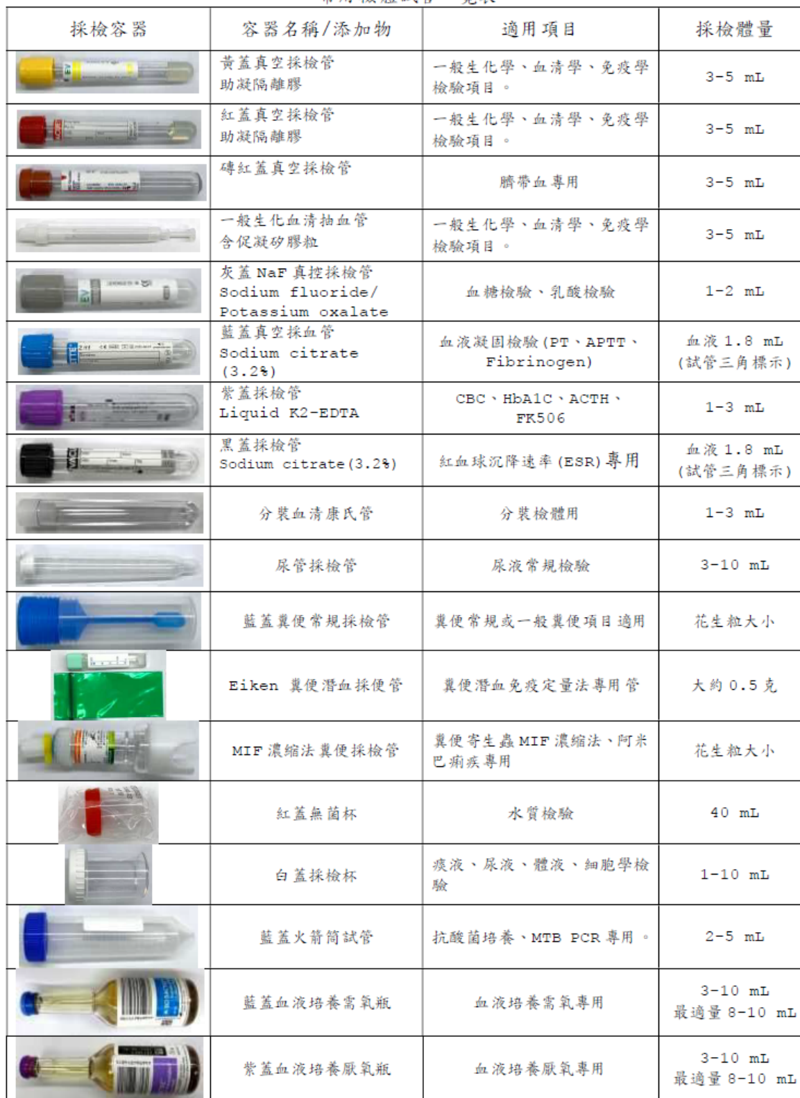
尚捷醫事檢所 常用檢體試管一覽表